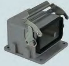
Bügel aus Edelstahl