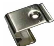
Sockel asym. PA66 / socket asym. PA66

Preise gültig ab 01.01.2017exkl. MwSt., freibleibend, Auftragsrabatt auf Anfrage /