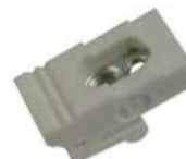
Sockel asym. / socket asym.