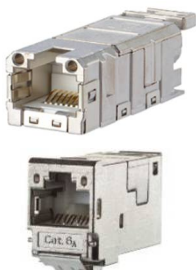
RJ45 Einsätze f. leeres aufschnappbares Modul ArtNr 440014 / RJ45 inserts for pluggable empty module artnr 440014