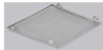
Filterhalter filter holder

Preise gültig ab 01.01.2018 exkl. MwSt., freibleibend, Auftragsrabatt auf Anfrage, NETTOPREISE prices are valid from 01.01.2018 excl. VAT, subject to change, discount upon request, NET PRICES