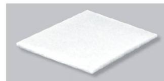
Synthetik Filtermatten synthetic filter mats