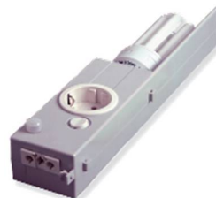
Mit Bewegungsmelder / with motion sensor

Preise gültig ab 01.01.2017 exkl. MwSt., freibleibend, Auftragsrabatt auf Anfrage / prices are valid from 01.01.2017 excl. VAT, subject to change, discounts upon request sonst. Konditionen siehe www.gogatec.com/AGB.pdf , techn. Änderungen vorbehalten / terms & conditions can be found on our website: www.gogatec.com/AGB.pdf , error, technical modifications and variations are reserved