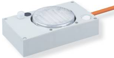
Ausführung mit Bewegungsmelder / with motion sensor