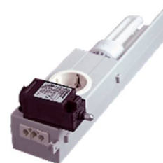
Mit Türkontakt / with door switch