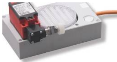
Ausführung mit Türkontakt-Rollenendschalter / with door roll-limit-switch