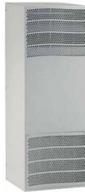
5708, 5709, 5710, 5715

Auch mit 120 V lieferbar! / Also available with 120 V!