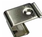
Socket asym. PA66 / socket asym. PA66