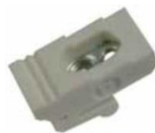
Socket asym. / socket asym.