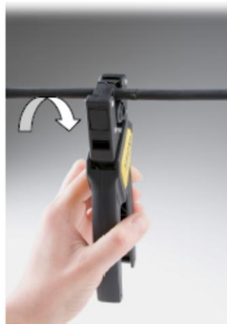
Rundschnitt links und rechts vom Längsschnitt durch 1/4 Drehbewegung der Zange