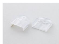
Seitliche Befestigung (Schraubbefestigung) Modell SZ-310AS