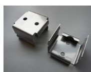
Seitliche Befestigung (Schraubbefestigung) Modell SZ - 310EU