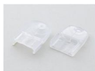
Seitliche Befestigung (CLB-24N-kompatibel) Modell SZ-310ASB