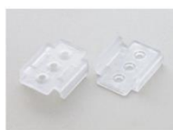
Hintere Befestigung (Schraubbefestigung) Modell SZ-310AR

Necessary mountings: type 100 to 600 - 2 pcs., type 900 to 1.200 - 4 pcs.