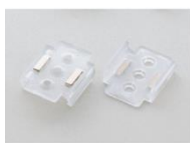
Hintere Befestigung (Magnetbefestigung) Modell SZ-310ARM